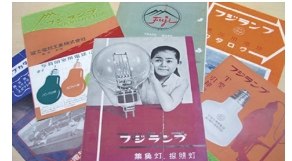
1950年代の弊社パンフレット

We at FUJI LAMP have been working in manufacturing for many years in the niche market of "specialty lamps" within the lighting industry. During that time we obtained an award from high-end users of the world for our Japanese-made quality. We will carry on with courage, passion, and together with good faith management guidelines to take advantage of a worldwide network and provide high-value products. We hope to continue to enhance FUJI LAMPs' brand value.